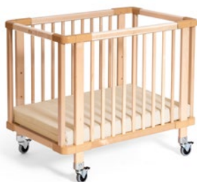
G302 Community Krippenbett