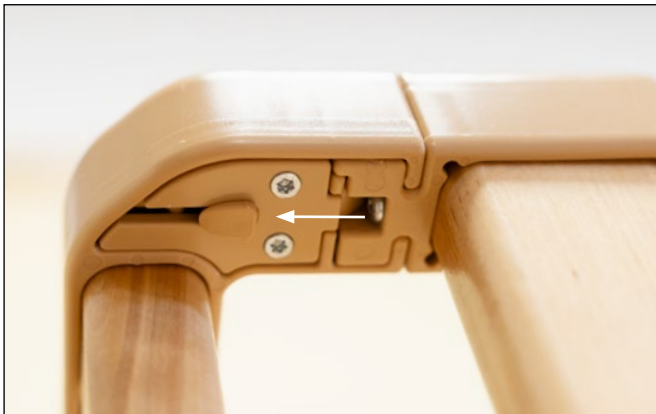
Schnappverschlüsse unter den Ecken (Ansicht von unten)