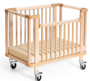
G309 Evakuierungs-Krippenbett Pro