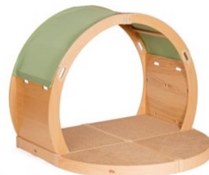
FlexiHöhle Bogeninsel M837 und M838