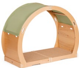
FlexiHöhle Bogen M835 und M836