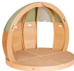
FlexiHöhle Muschelinsel M830 und M832