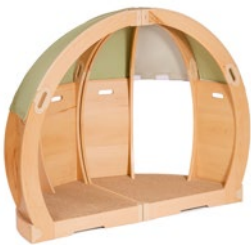
FlexiHöhle Muschel M820 und M825

Die Verpackung dieses Produkts ist recyclingfähig (Pappe und LDPE). Bitte halten Sie sich an die örtlichen Recyclingrichtlinien.