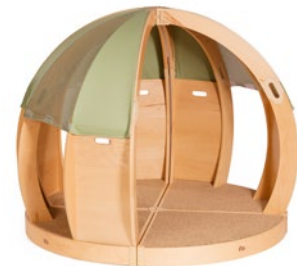
FlexiHöhle Muschelhaus M833 und M834