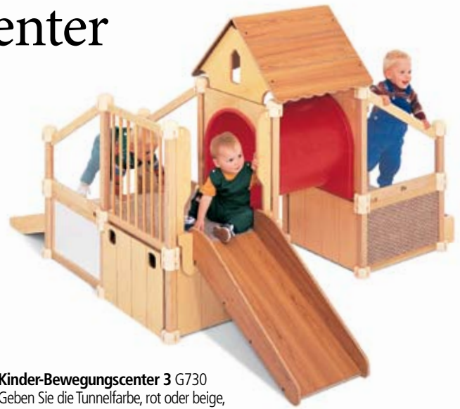
Kinder-Bewegungscenter 3 G730 Geben Sie die Tunnelfarbe, rot oder beige, an.

Dieses kompakte Kinder-Bewegungscenter bietet altersgerechte körperliche Herausforderungen, wie Treppen, Rutschen und geneigte Rampen.