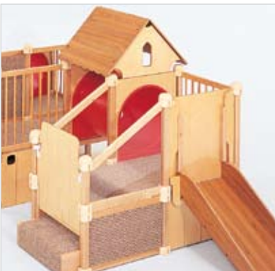
Abnehmbare Gitter lassen Sie das gesamte Bewegungscenter oder einfach nur die Rutsche abschließen.