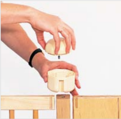
Unser Pfosten-und-Ring-Verbindungssystem ist kindersicher und werkzeugfrei!