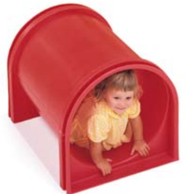
Roter Tunnel G752 Beiger Tunnel G753 50 cm x 62 cm

Der Tunnel kann auch allein verwendet werden.