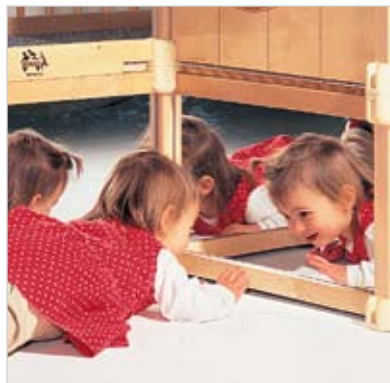
Spiegel faszinieren kleine Kinder und fördern visuelle Spiele wie Versteckspielen.